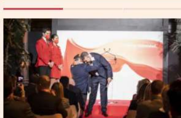
Presentación de iryo