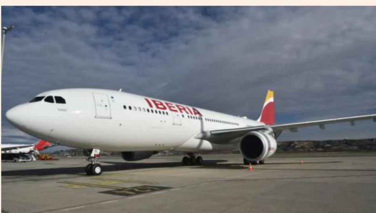
Un avión de Iberia.